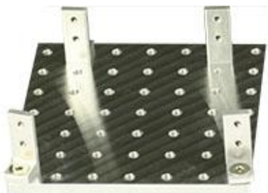
Versa-Plate H49 SEM サンプルホルダー サイズ 82x82mm M4 ネジ穴数 49 個 S25 ブラケット 4 個付き Ø14 mm JEOL スタブ