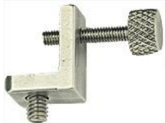
Versa-Plate S15 ブラケット つまみネジ付き 15x10x13mm