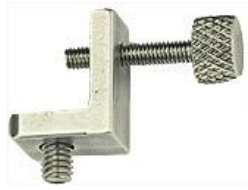
Versa-Plate S15 ブラケット つまみネジ付き 15x10x13mm