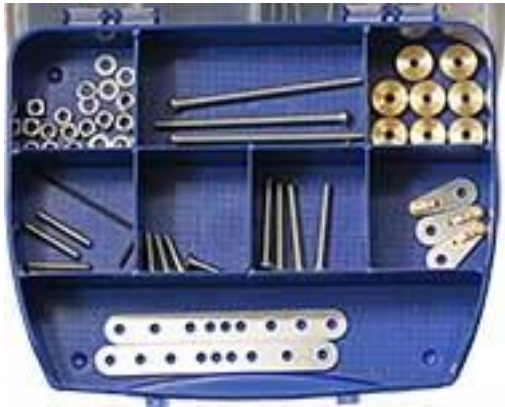
Versa-Plate UV1 ユニバーサル クランピング キット