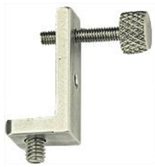
Versa-Plate S25 ブラケット つまみネジ付き 25x10x13mm