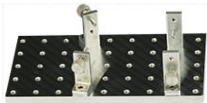
Versa-Plate H45 SEM サンプルホルダー サイズ 106x58mm M4 ネジ穴数 45 個 S25 ブラケット 4 個付き M4